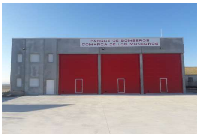
Construcción de parque de bomberos de la Comarca de Los Monegros en Sariñena (Huesca).