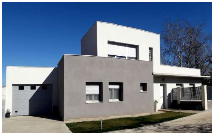
Vivienda unifamiliar en la provincia de Huesca.