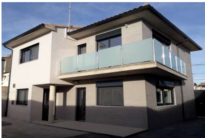
Vivienda unifamiliar en la provincia de Zaragoza.