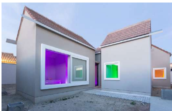
Vivienda Unifamiliar en la provincia de Zaragoza.