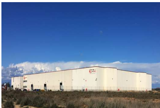
Ejecución de nave para fábrica de envases con una superficie de 2.800 m2 en la provincia de Huesca.