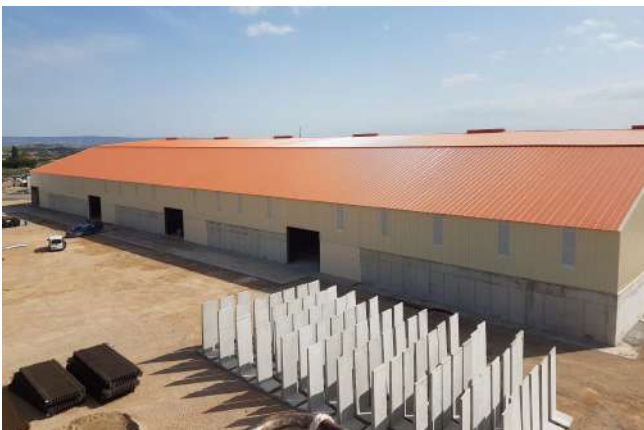
Construcción de una nave de 9.200 m 2 y 16.000 m 2 de soleras para la Cooperativa de Los Monegros.