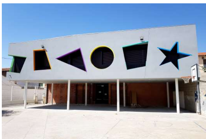
Ampliación del colegio C.R.A L' Albada de Bujaraloz.