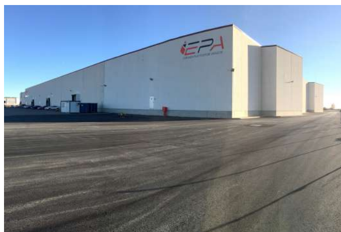
Ejecución de asfaltado con una superficie de 5.000 m2 en la provincia de Huesca.