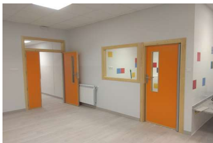
Adecuación de aulas en CEIP San Vicente en Huesca.