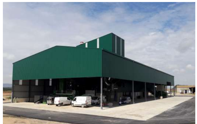
Ejecución de nueva planta deshidratadora 3.000 m 2 de nave y urbanización exterior en Almuniente (Huesca)