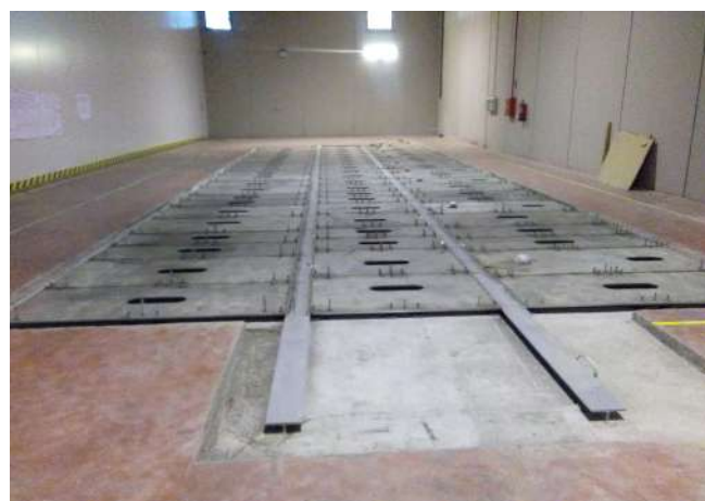
Instalación de suelo inoxidable AISI-304 de 120 m2 para apoyo de máquina de impresión en la provincia de Huesca.

"ATC Constructora, la llave hacia la Calidad"