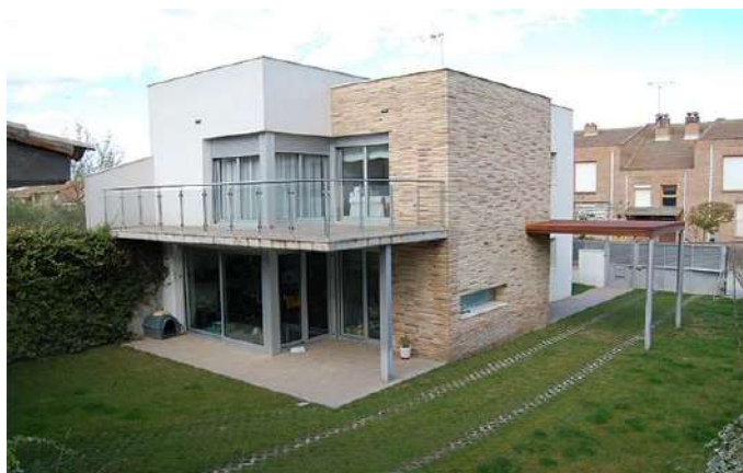
Viviendas Unifamiliares en la provincia de Huesca.