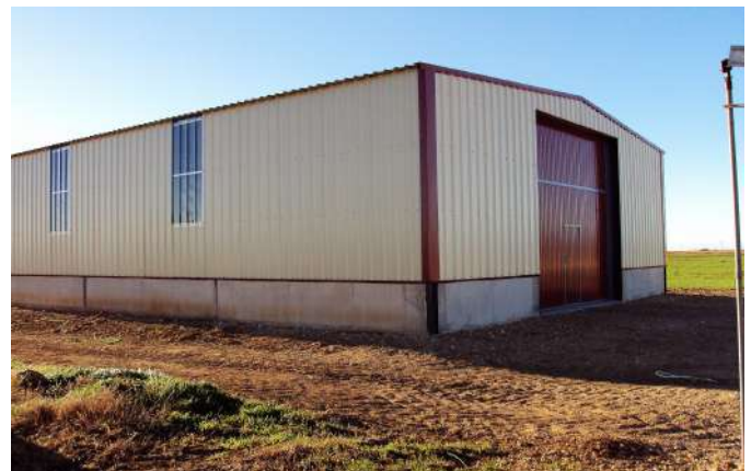
Construcción de almacén agrícola en la provincia de Huesca.