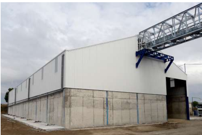
Construcción de nave de almacenamiento de cereal para la Cooperativa San Agustín en Bujaraloz (Zaragoza).