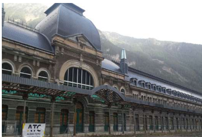
Restauración del vestíbulo de la Estación Internacional de Canfranc.