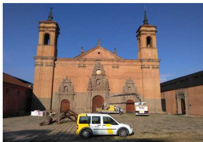
Adecuación y conservación del Monasterio de San Juan de la Peña.