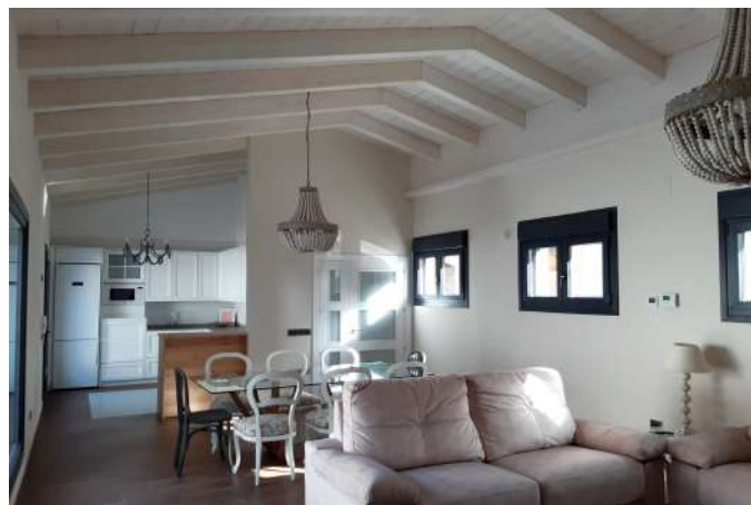
Vivienda unifamiliar en la provincia de Huesca